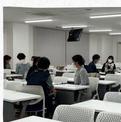
<春期講座開講の様子>

2023年4月1日（土）、昭和大学上條記念館にて『春期入学式・開講式』を挙し、新たに122名が入学しました。開校3年目となる2023年度も、「医系総合大学によるアカデミックな学びの場」をコンセプトに、社会人の「知の探究」の一助となる文化の発信拠点として、社会人の学び直しであるリカレント教育を提供していきます。